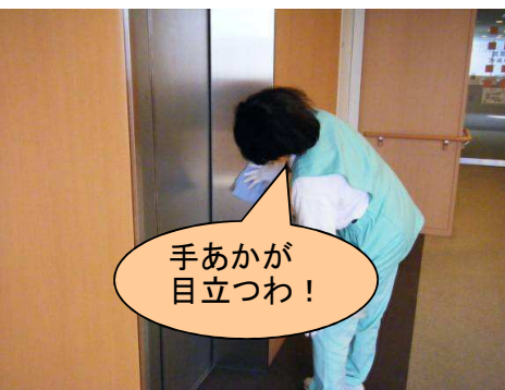
ステンレスの部分は洗剤を使用して拭き上げます。