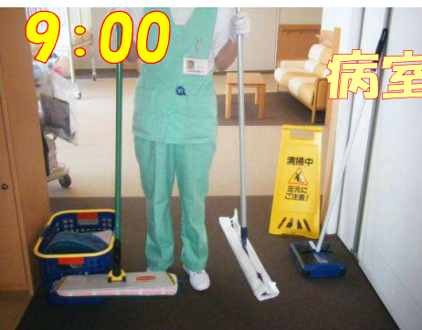
専用の道具を使用し床を清掃します。