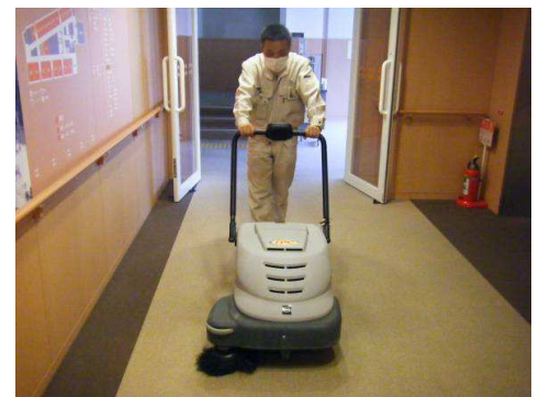
廊下はカーペット専用の