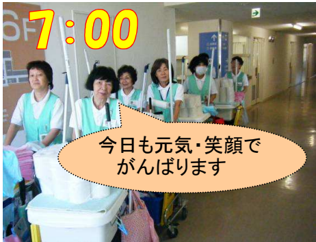
朝一番に各持ち場のトイレ清掃に向かいます。

私たちは患者様が快適な入院生活を送り、またご来院の方が気持ちよく利用していただけるように院内の清潔清掃に日々努力しています。そこで私たちの作業風景を、一部ですが紹介させていただきます。