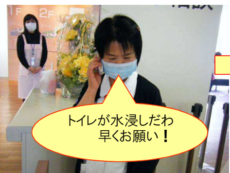
トイレに異常がある時はすぐに連絡を受けます。