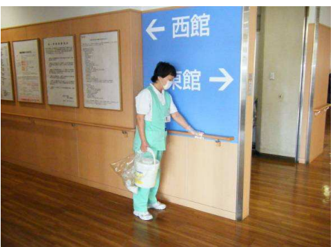
手摺りや触れるところは