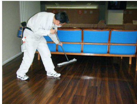
一方では待合室の床も清掃します。