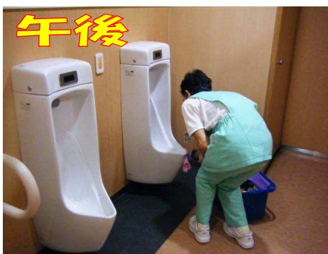
外来ではトイレの巡回清掃で必死です。