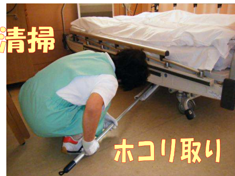
ベッドの下や隅は、特に念入りに作業します。