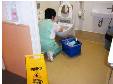
気持ち良く使ってもらうように丁寧に清掃します。