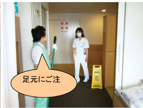
安全にも充分配慮します。