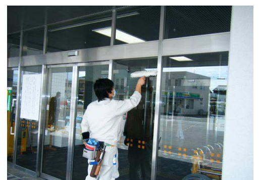
玄関は建物の顔です。