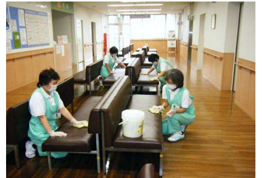
イスなどは患者様が来院