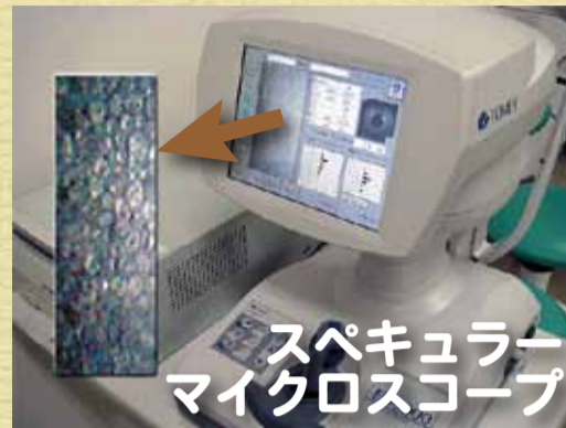
スペキュラー マイクロスコープ