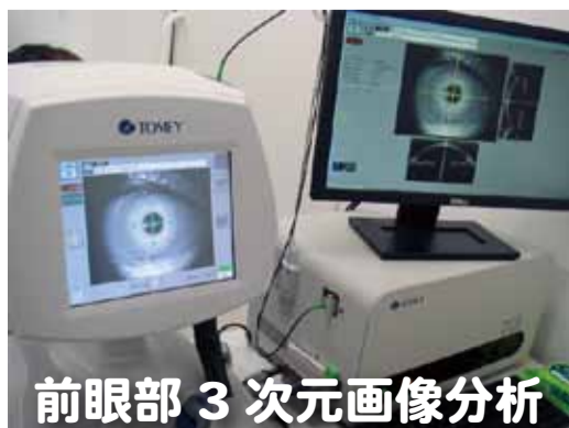
前眼部 3次元画像分析

かくまく こうさい ぐうかく すいしょうたい 角膜、虹彩、隅角、水晶体といった 眼の前の部分（前眼部）の状態を詳 しく検査します。眼の中の状態を、 直接器械が眼に触れることなく、短 時間で測定できます。